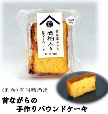
〈酒粕〉皇国晴酒造 昔ながらの 手作りバウンドケーキ 【食やく】アーモンド 佐々木千歳堂