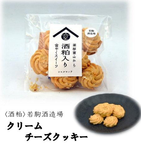
〈酒粕〉若駒酒造場 クリーム チーズクッキー 【食やく】チーズ シャルロット駅前店