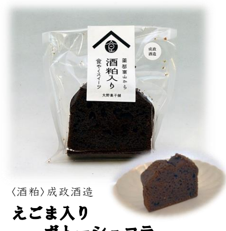
〈酒粕〉成政酒造 えごま入り ガトーショコラ 【食やく】えごま 大野菓子舗