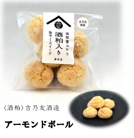
〈酒粕〉吉乃友酒造 アーモンドボール 【食やく】アーモンド 新栄堂