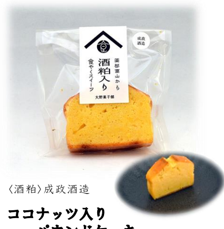
〈酒粕〉成政酒造 ココナッツ入り バウンドケーキ 【食やく】ココナッツ 大野菓子舗