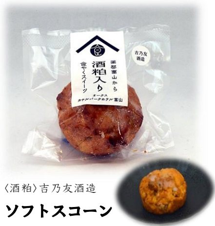
〈酒粕〉吉乃友酒造 ソフトスコーン 【食やく】胡桃 オークス カナルパークホテル富山